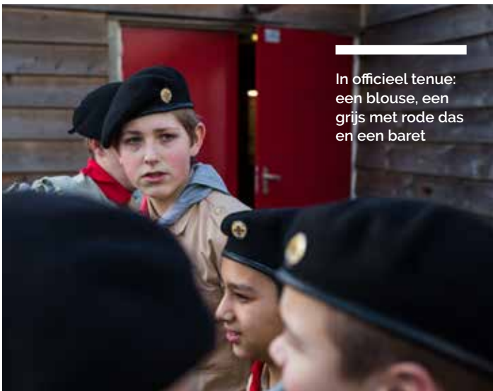
In officieel tenue: een blouse, een grijs met rode das en een baret